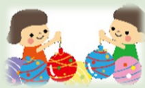
(夏まつり実行委員会)